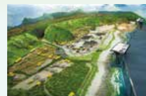
新生訓導処時期の模型展示