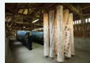
新生訓導処時期の第三大隊の展示エリア(2)