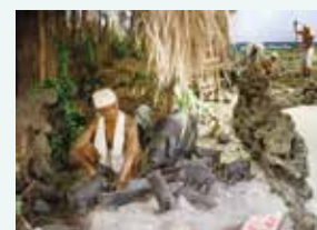
新生訓導処時期の第三大隊の展示エリア(1)