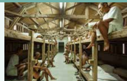
新生訓導処時期の模型展示