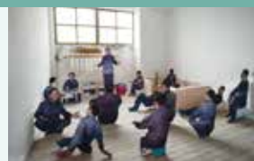
監房の復原展示エリア